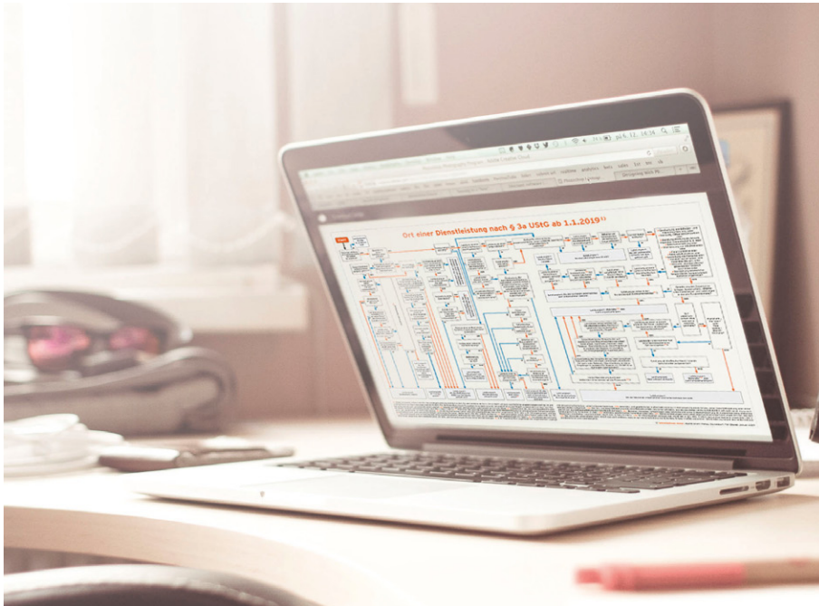
Abb.: Schaubild 'Ort einer Leistung § 3a UStG'

www.markt-intern.de/branchenbriefe/steuern-mittelstand/umsatzsteuer-intern/schaubilder/